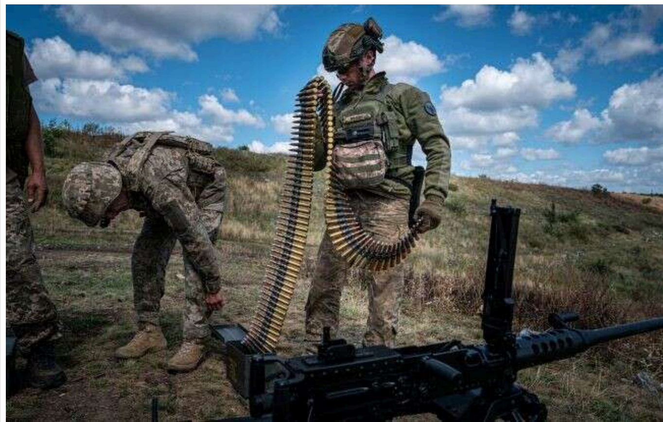
Ситуація на фронті: майже третину боїв зафіксовано на Курахівському напрямку

Станом на 22:00, 2 листопада, на фронті з початку доби відбулися 167 бойових зіткнень. Майже третина з них була на Курахівському напрямку.