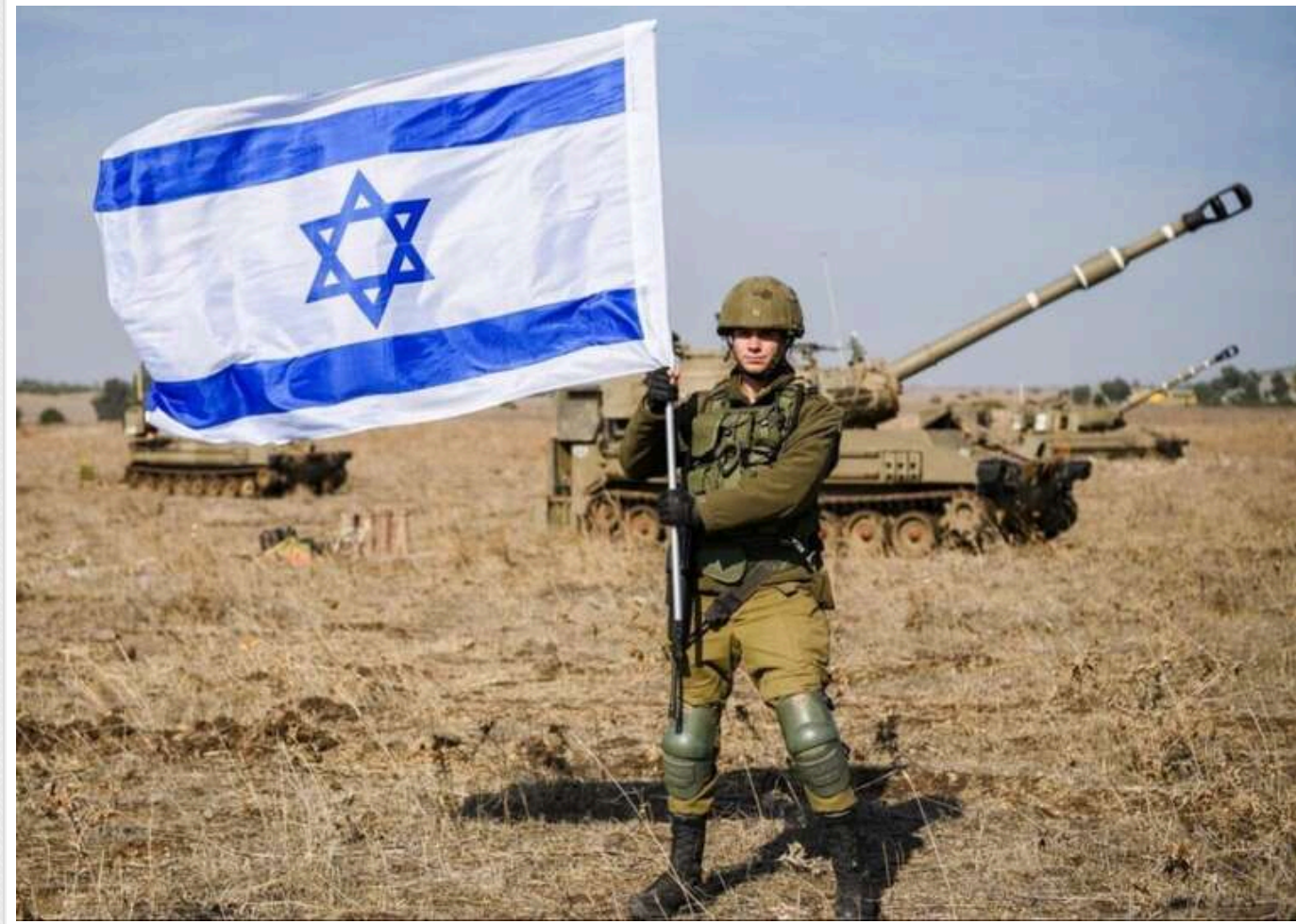
Штати не зможуть стримати Ізраїль, якщо Іран нападе, - ЗМІ

Адміністрація президента США Джо Байдена застерегла Іран уникати повторних нападів на Ізраїль. В іншому випадку Америка не зможе втримати ізраїльтян від дій у відповідь.