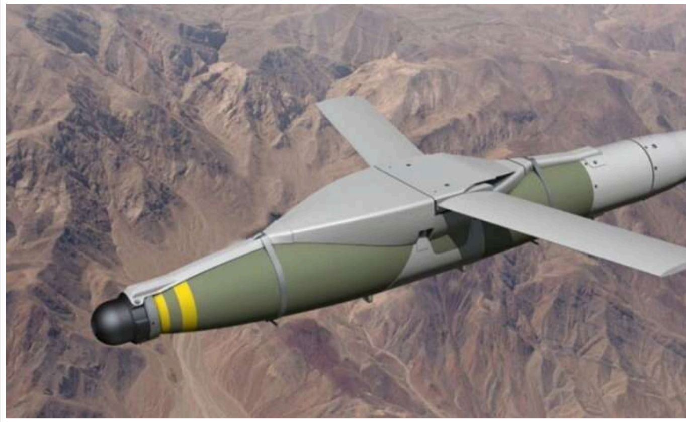
Австралія передала Україні плануючі авіабомби JDAM-ER

Австралія передала Україні кілька плануючих бомб Joint Direct Attack Munition Extended-Range (JDAM-ER).