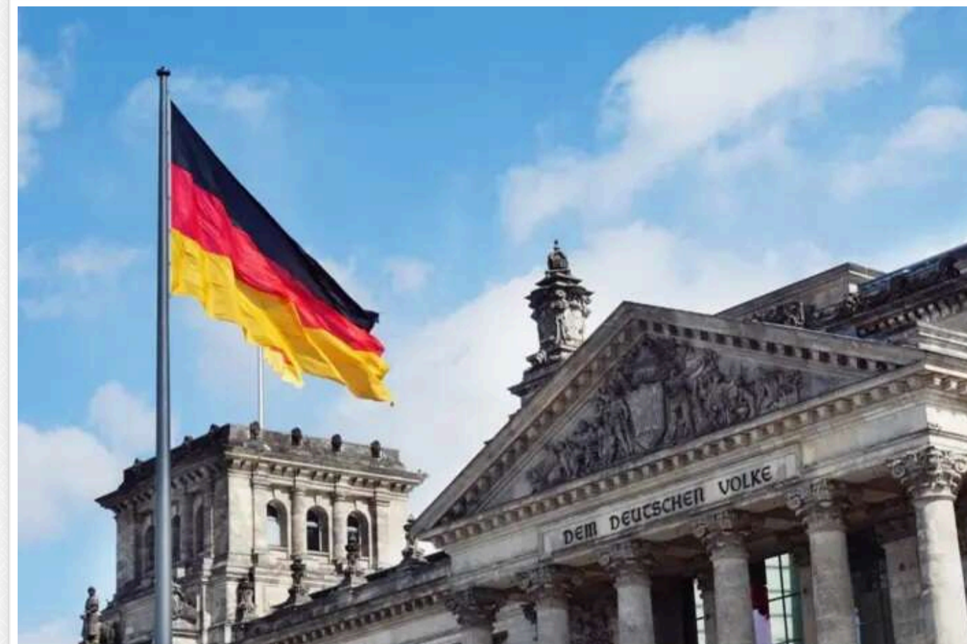
У Німеччині звинувачують "ледаче" покоління Z в економічних проблемах країни

У Німеччині керівники найбільших компаній звинувачують "ледаче" покоління Z в економічних проблемах країни, стверджуючи, що вони беруть лікарняні майже 20 разів на рік, повідомляє Fortune.