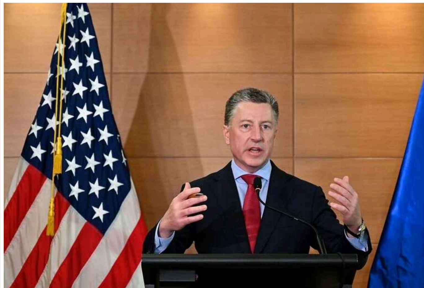
Трамп не хоче, щоб Україна зазнала поразки і його зробили за це відповідальним, - Волкер

Курт Волкер, колишній спецпредставник США з питань України, поділився своїми думками про Дональда Трампа та його потенційну позицію щодо війни в Україні. За словами Волкера, Трамп не хоче, щоб Україна зазнала поразки під час його можливої каденції, оскільки це могло б призвести до звинувачень у його бездіяльності.