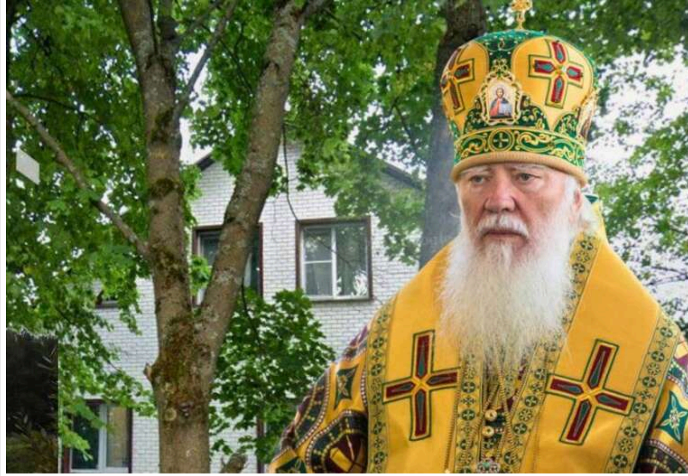
Митрополит Хустської єпархії УПЦ МП Марк буде собі будинок під Москвою: був замішаний у скандалах і раніше

Митрополит Хустської єпархії УПЦ МП Марк Петровіч, який має російське громадянство, зводить розкішний приватний будинок під Москвою. Його вартість становить щонайменше 250 тисяч доларів.