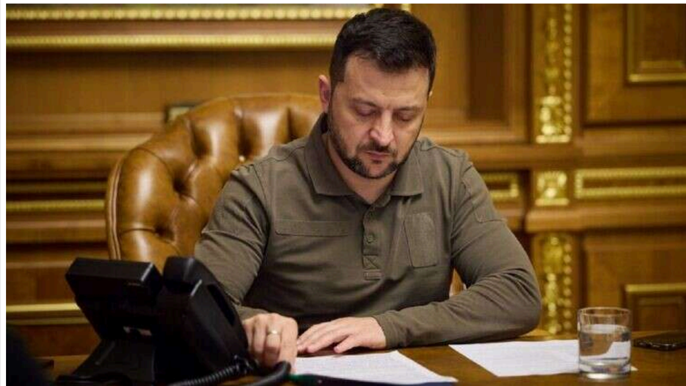
Зеленський змінив дату Дня ракетних військ і артилерії

Зеленський за добу до Дня ракетних військ і артилерії скасував це свято і переніс його на місяць уперед.