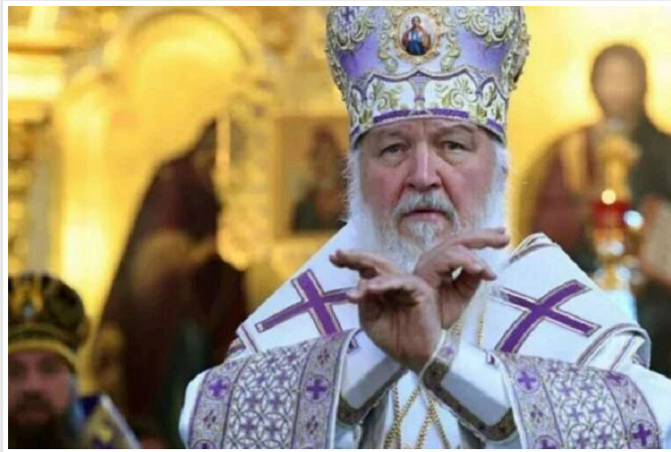
Глава РПЦ Кирило дорікнув росіянам за апатичність та незацікавленість у війні

Керівник Російської православної церкви (РПЦ) патріарх Кирило під час своєї промови 31 жовтня звернув увагу на соціальні та ідеологічні поділи в російському суспільстві, повторюючи звичні аргументи для обґрунтування війни в Україні. Кирило підкреслив, що деякі росіяни залишаються байдужими та не цікавляться подіями на фронті. Він також розкритикував тих, хто вибирає особистий комфорт і "несерйозні розваги" замість підтримки війни.