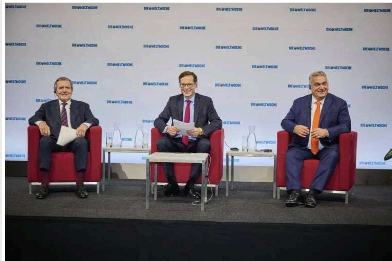
Орбан під час зустрічі зі Шредером заявив про поразку України у війні

Швейцарський журнал правового напрямку Weltwoche організував у Відні конференцію «Мир у Європі», на якій були присутні колишній канцлер Німеччини Герхард Шредер і прем'єр-міністр Угорщини Віктор Орбан.