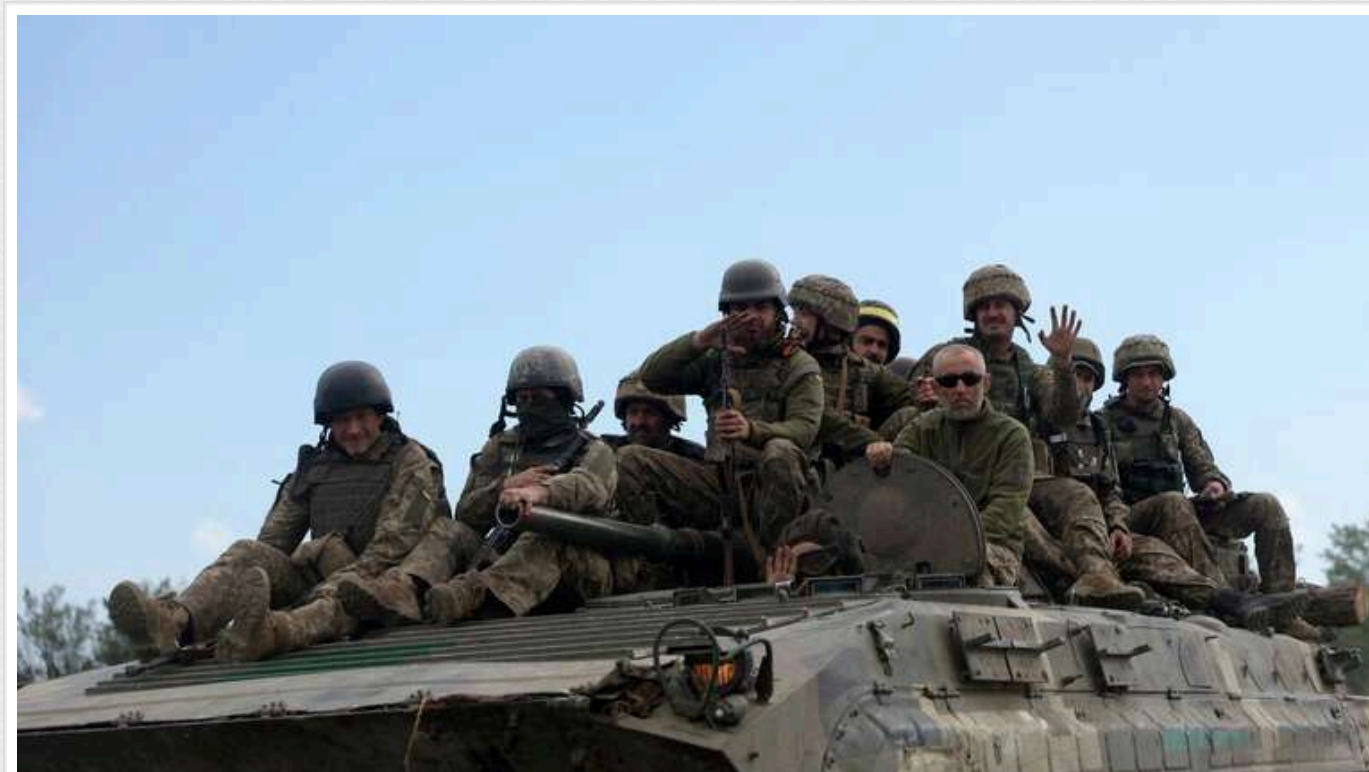
ЗСУ зараз стримують один із найпотужніших наступів росіян від початку повномасштабного вторгнення, – Сирський

Про це повідомив головнокомандувач ЗСУ Олександр Сирський.