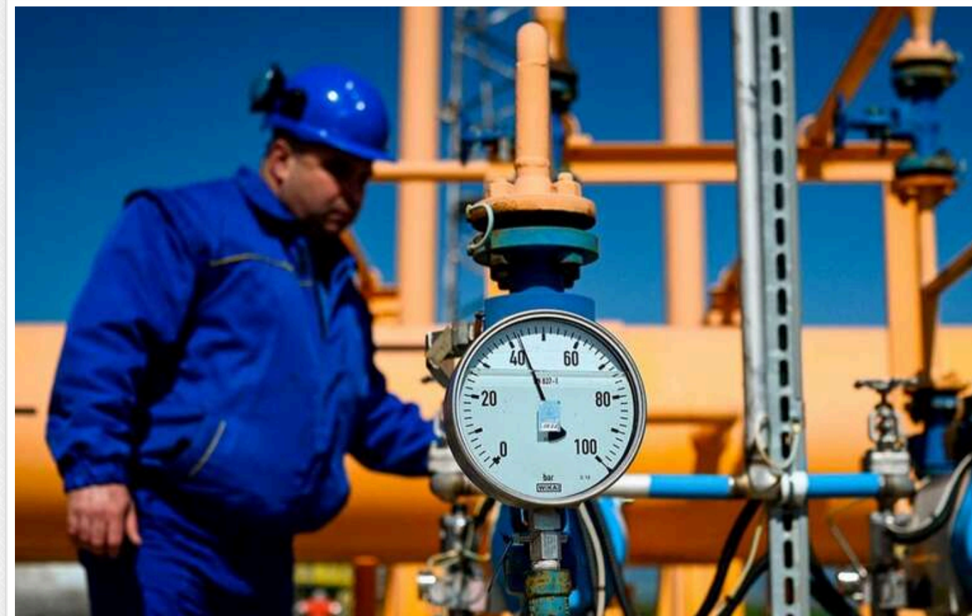
Зеленського закликали ініціювати впровадження санкцій РНБО на транзит нафти та газу російського походження через Україну

Вчора, 1 листопада, на сайті президента було зареєстровано петицію, в якій відомі експерти в сфері енергетики закликали Володимира Зеленського ініціювати запровадження санкцій РНБО на транзит Україною нафти та газу російського походження. За даними експертів, на третій рік повномасштабної агресії транзитом через Україну все ще проходить близько 15 млрд м3 газу та 14.5 млн тонн нафти російського походження, що щорічно приносить ворогу майже 12 млрд доларів та безпосередньо поповнює його військовий бюджет.