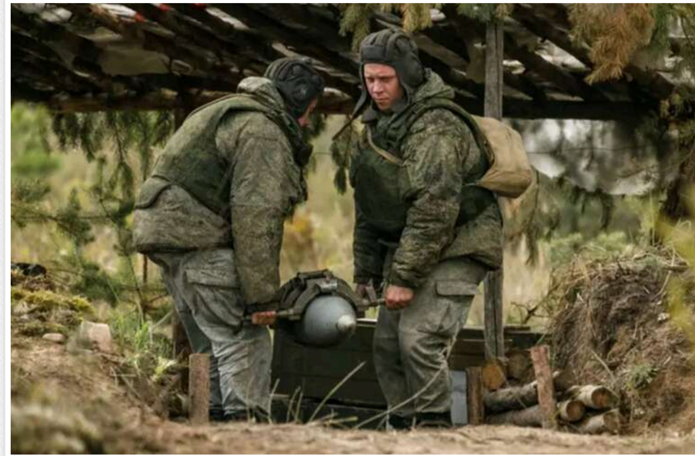
Російські загарбники наступають на фронті завширшки до 65 кілометрів - від Селидового до Великої Новосілки - й планують оточити район Курахового

До кінця року Україна може втратити це місто, про це повідомляє американський журнал Newsweek.