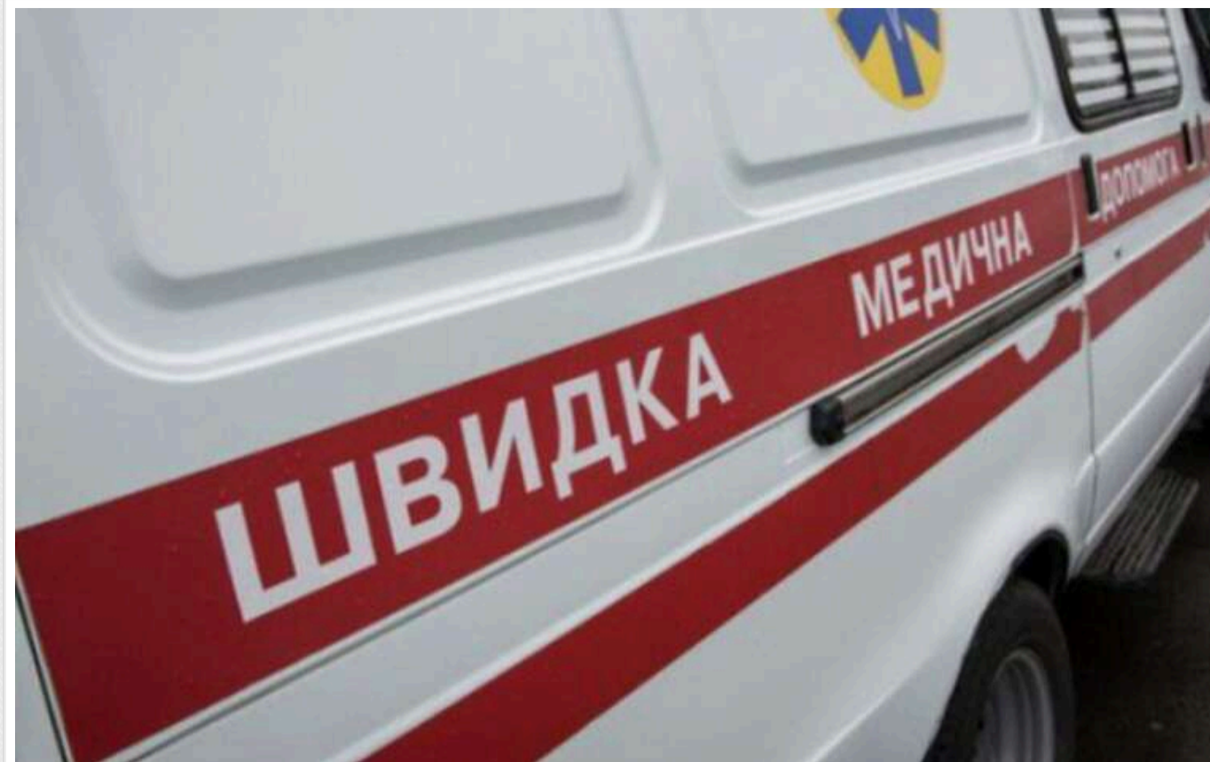
На Херсонщині через обстріл окупантів поранена 16-річна дівчина

У Херсонській області внаслідок ранкового обстрілу військами РФ селища Зеленівка Херсонської міської громади отримала поранення 16-річна дівчина.