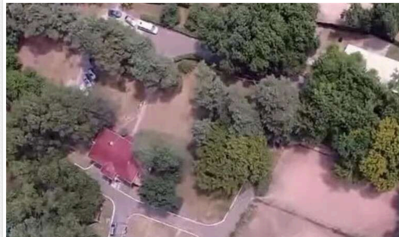
Київ знову отримав у власність земельну ділянку на Трухановому острові, де Медведчук незаконно збудував базу для своїх охоронців

Суд повернув Київській міськраді у власність земельну ділянку на Трухановому острові площею 1,1 га. На цій території було незаконно створено тренувальну базу для охоронців колишнього народного депутата Віктора Медведчука.