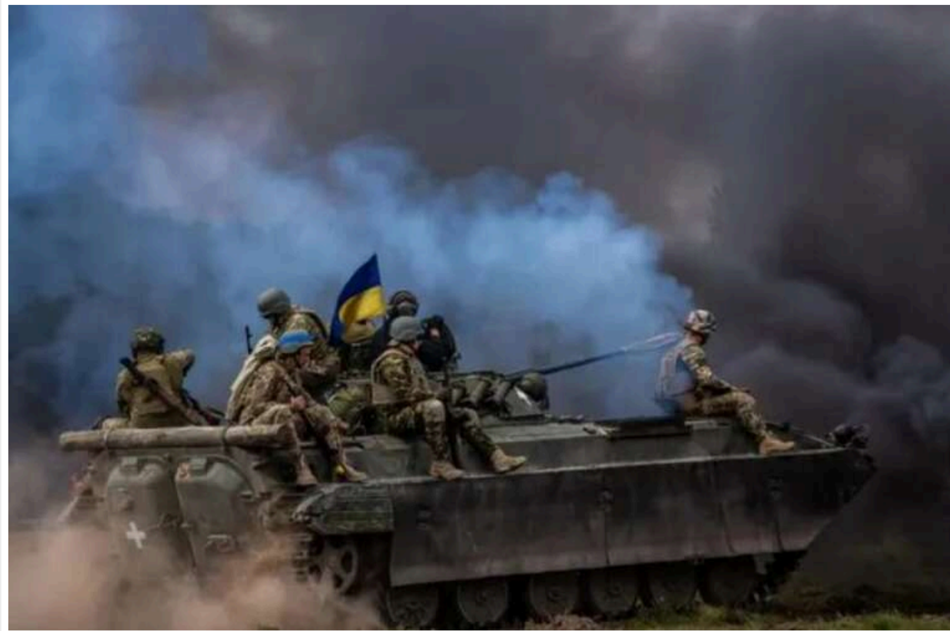
Видання New York Times розкрило втрати ЗСУ

Російський наступ стабільно набирає сили, і песимізм у Києві та Вашингтоні посилюється. Війна більше не виглядає безвихідною. У США вважають, що Україна "вступила у похмуру стадію".