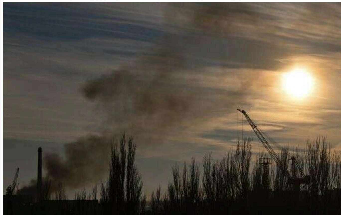
Окупанти завдали ударів по Куп'янську