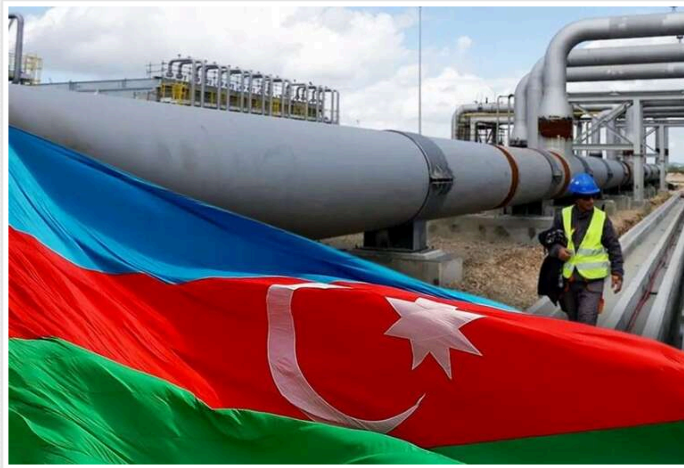
Газова угода Європи з Азербайджаном не намічається, - Reuters

Угоди з газу між Європою та Азербайджаном на зараз не передбачаються, повідомляє Reuters, з посиланням на словацьку державну компанію SPP.