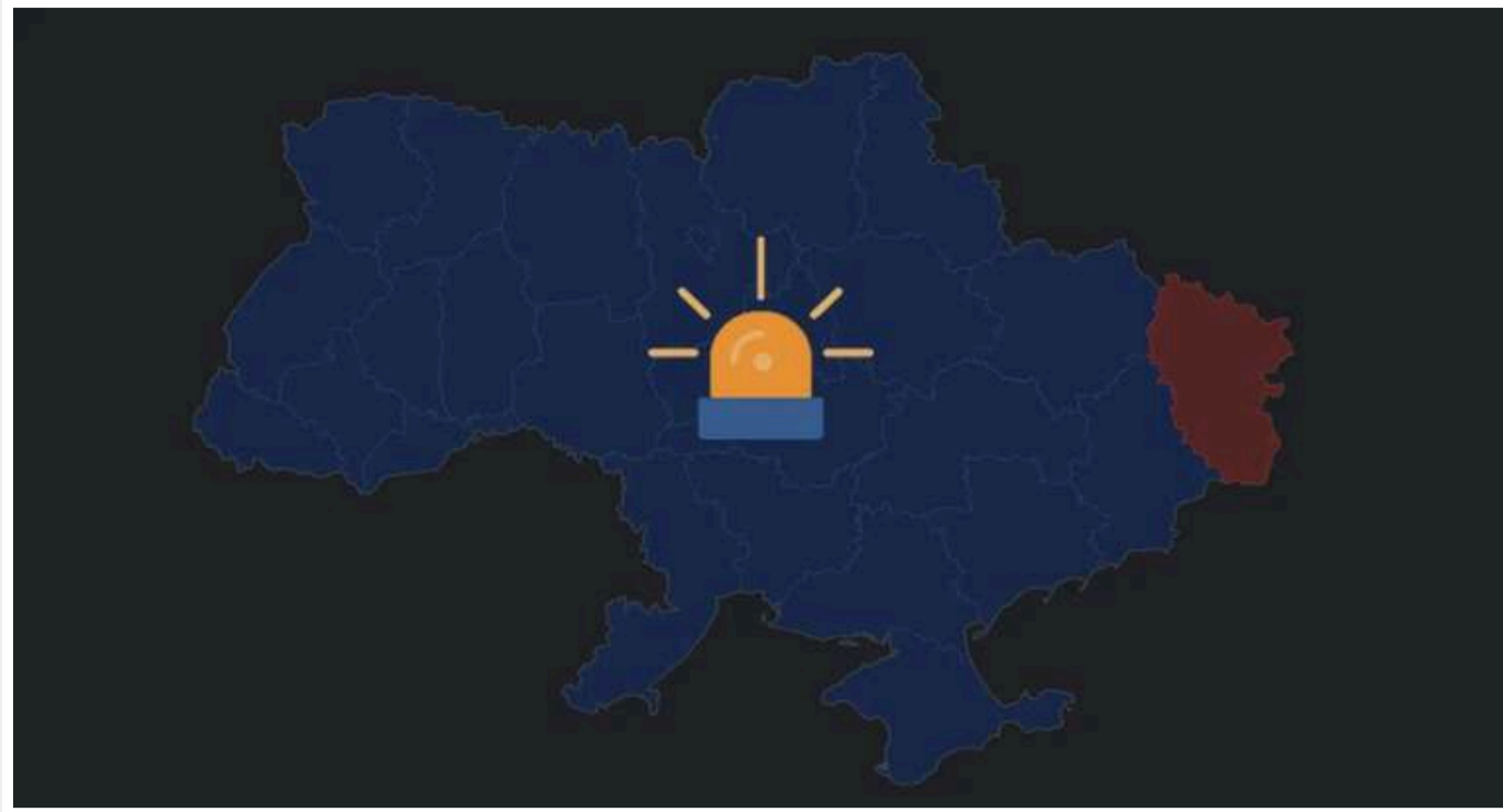
Україну знову атакують російські "шахеда"

Російські окупанти сьогодні вкотре запустили ударні дрони типу "Шахед" у напрямку України. У декількох областях вже оголошено повітряну тривогу.