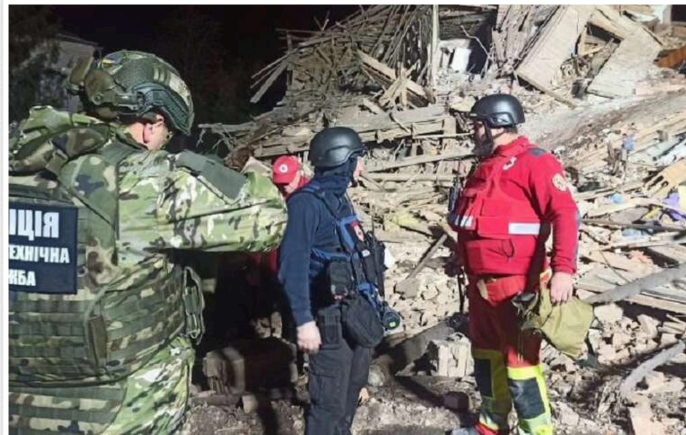
Окупанти завдали ударів по місцю дислокації поліції у Харкові: є загиблий і багато постраждалих

Сьогодні, 1 листопада, російські війська завдали ракетного удару по місцю дислокації поліції в Харкові. Один поліцейський загинув, 30 осіб зазнали поранення.