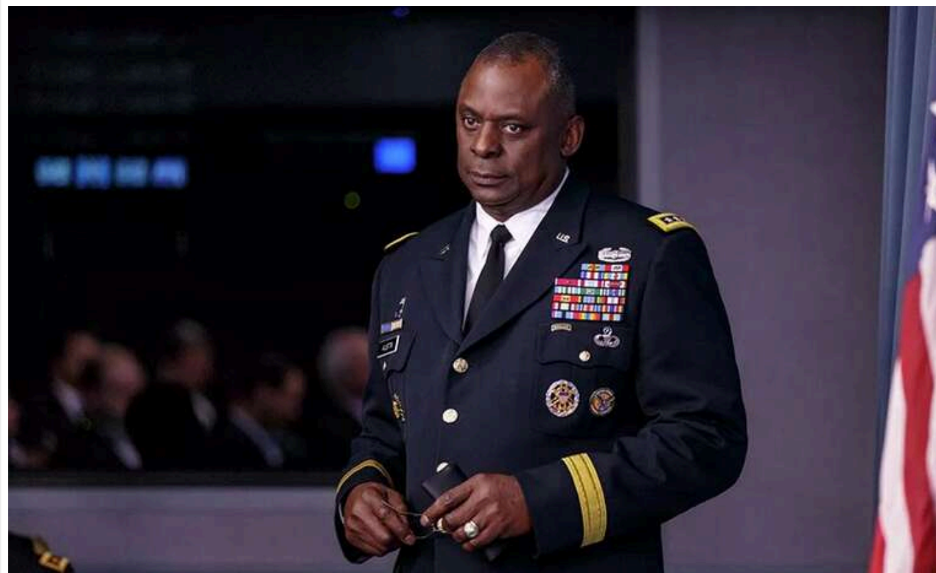
Ллойд Остін опублікував статтю про війну в Україні в журналі Foreign Affairs

Глава Міноборони США Ллойд Остін опублікував статтю в журналі Foreign Affairs з приводу війни в Україні.