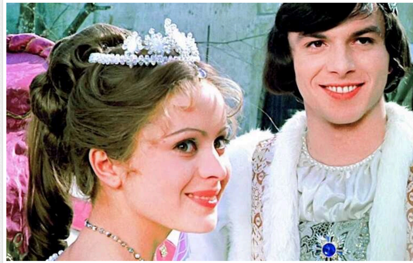
У Німеччині на новорічні свята 15 разів показуватимуть фільм, знятий країнами соцтабору та популярний у СРСР

На німецькому телебаченні в Новий рік фільм «Три горішки для Попелюшки», знятий країнами соцтабору і популярний в СРСР, покажуть 15 разів, повідомляє Bild.