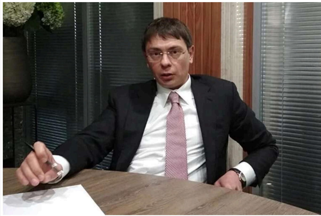
Колишнього народного депутата Крючкова оголосили у розшук

Національне антикорупційне бюро (НАБУ) оголосило в розшук народного депутата V скликання, колишнього голову правління холдингової компанії "Енергомережа" Дмитра Крючкова. Його звинувачують в організації заволодіння коштами Черкасиобленерго та Запоріжжяобленерго у 2014-2015 роках.