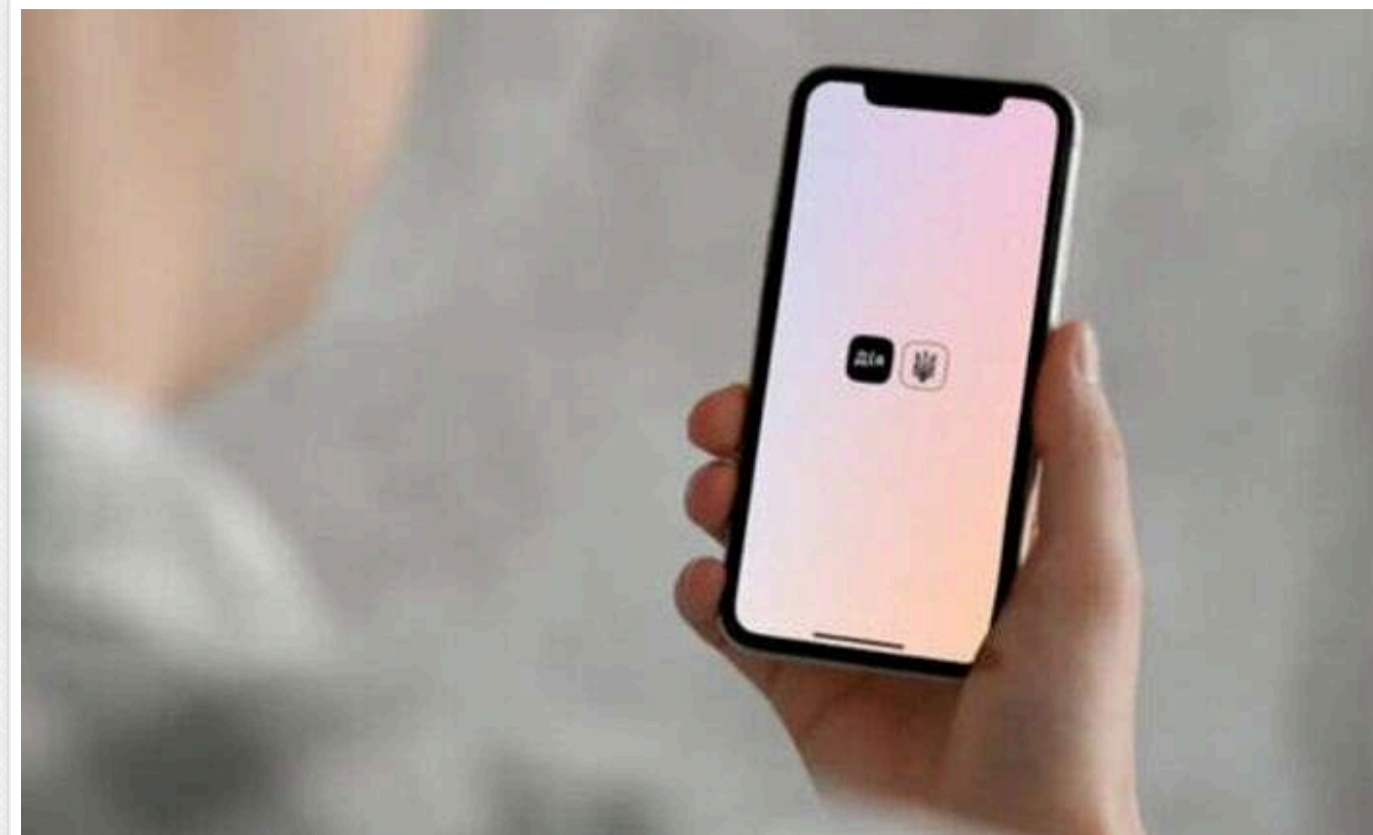
У «Дії» запустили нову послугу – продовження граничних строків валютних розрахунків

Міністерство економіки запускає онлайн-процедуру продовження граничних строків валютних розрахунків у міжнародній торгівлі. З 31 жовтня нова послуга для юридичних осіб та ФОПів, що займаються зовнішньоекономічною діяльністю, доступна в режимі бета-тестування на порталі Дія.