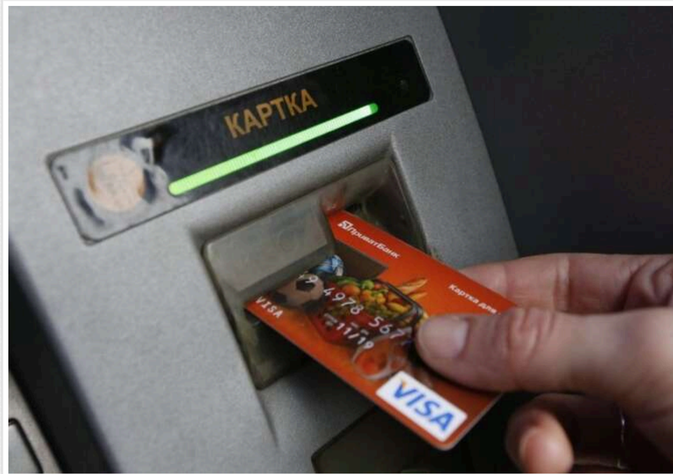
ПриватБанк не дозволив українці зняти гроші з її картки за кордоном

Клієнтка державного ПриватБанку поскаржилася на неможливість зняти гроші за кордоном через термінал банку з картки самого "Привату". За її словами, пристрій "відхилив транзакцію з метою безпеки". Водночас вона зазначила, що її подруга без проблем знімає кошти з такої ж картки.