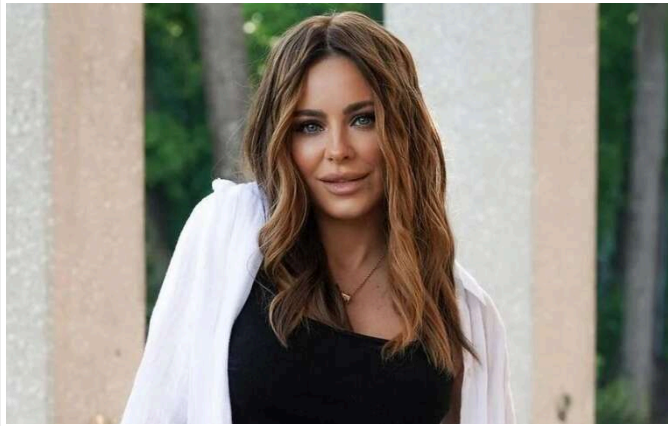
Ані Лорак відмовили в російському громадянстві

Співачка-запроданка Ані Лорак, яка продовжує будувати кар'єру у РФ і замочує криваву війну на Батьківщині, отримала відмову у російському громадянстві. Окупанти відхилили її заяву через фінансові проблеми.