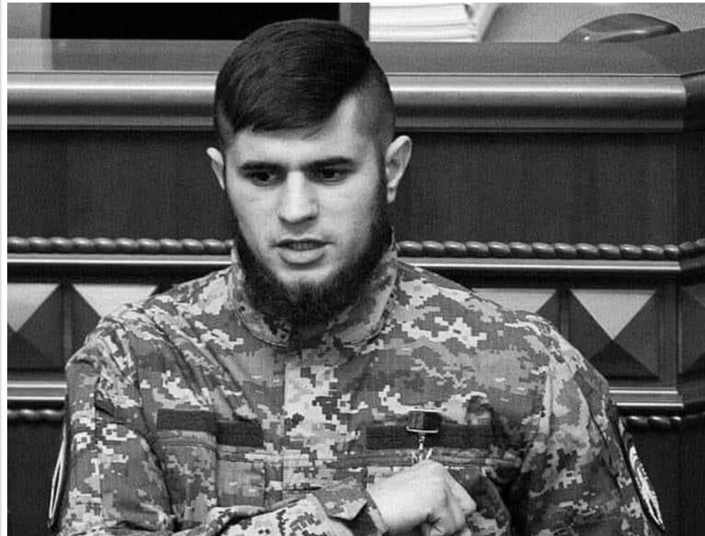
Українці вшанували пам'ять Дмитра Коцюбайла "Да Вінчі", який загинув за Україну: сьогодні йому могло б виповнитися 29 років

У п'ятницю, 1 листопада, виповнилося б 29 років Герою України Дмитру Коцюбайлу, військовому з позивним "Да Вінчі", командирі 1-ї ОМБ "Вовки Да Вінчі" ЗСУ. Він загинув 7 березня 2023 року під час боїв поблизу Бахмута на Донеччині — один з унікаль мінотетної мінці, що розірвалася поруч, алучив йому в шию.