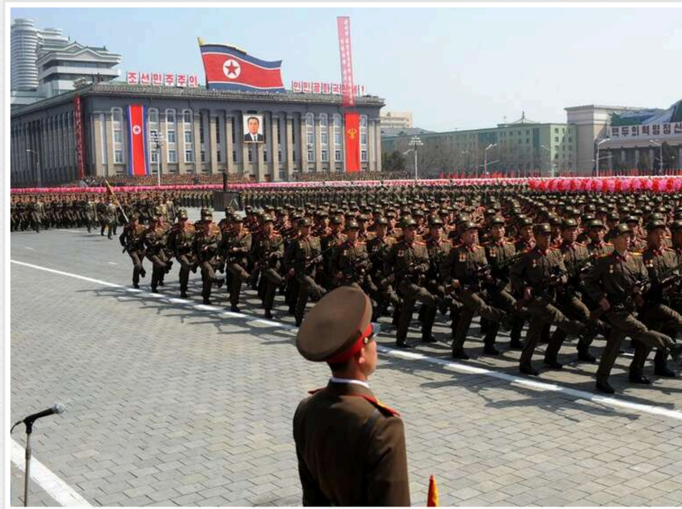
В КНДР назвали війну РФ в Україні "священною" і заявили про підтримку Кремля

У КНДР заявили, що будуть "твердо стояти поруч з російськими товаришами", і виразили впевненість у перемозі агресорки РФ.