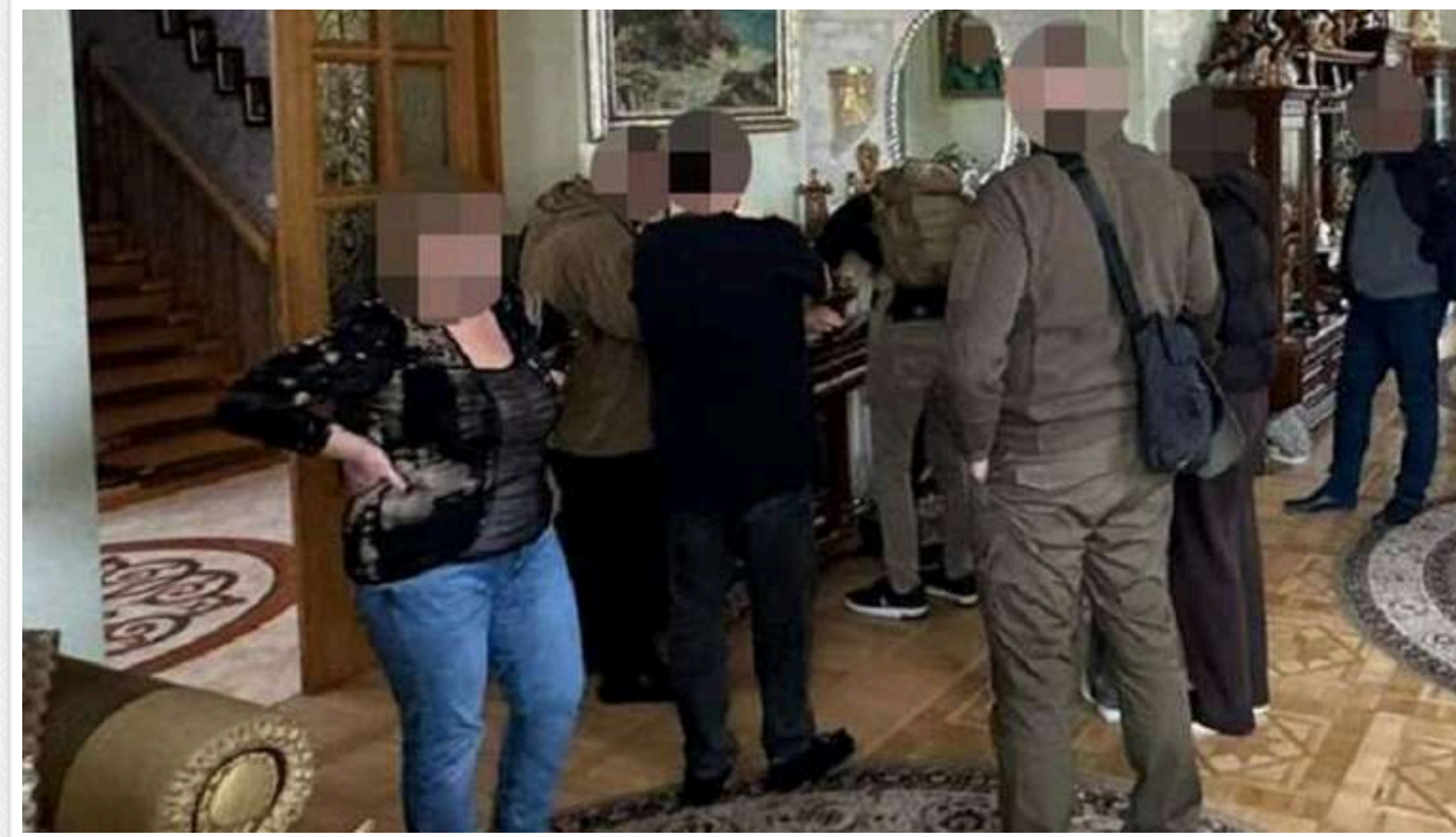
У приватному львівському університеті викрили масштабну схему для ухилиянтів

Одним з організаторів цієї схеми є 64-річний полковник і професор Любомир Сопільник.