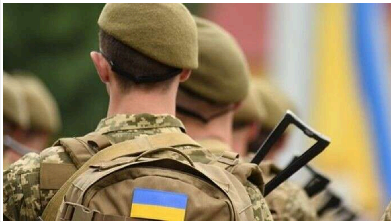
В Кабміні спростили процес розформування добровольчих формувань

Кабмін спростив процес розформування добровольчих формувань в Україні.