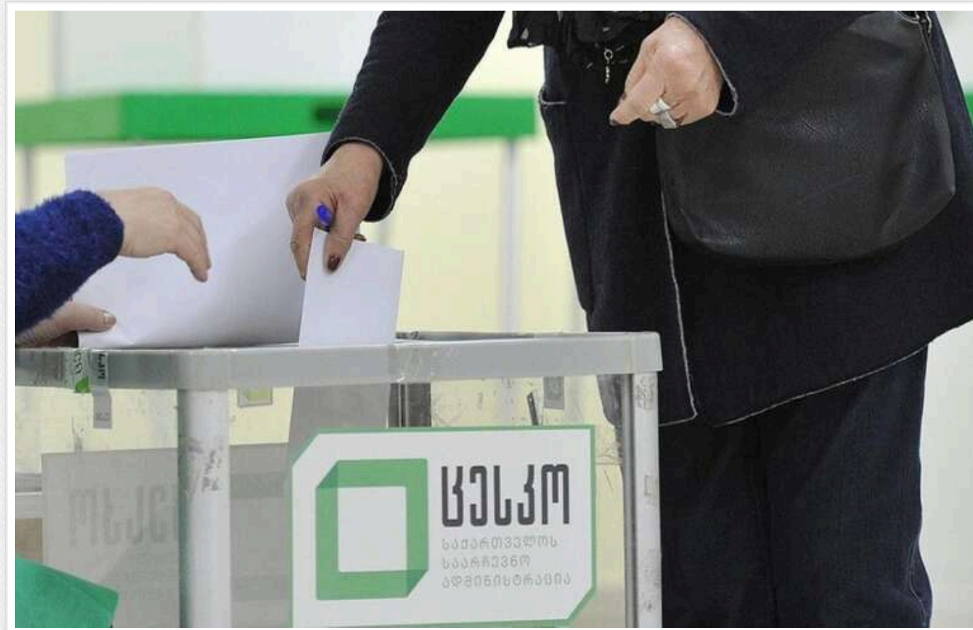
Компанії, які проводили екзитполи для грузинської опозиції, ставлять під сумнів офіційні результати

Дві американські соціологічні компанії, які проводили екзитполи на парламентських виборах у Грузії 26 жовтня, поставили під сумнів офіційні результати з перемогою правлячої партії.