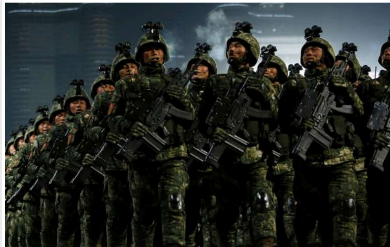
Розвідка Естонії оцінила, чи зможуть північнокорейські військові бути ефективними на війні проти України

Присутність північнокорейських підрозділів на українському фронті на цей час не призведе до суттєвих змін, і, ймовірно, вони зазнають значних втрат.