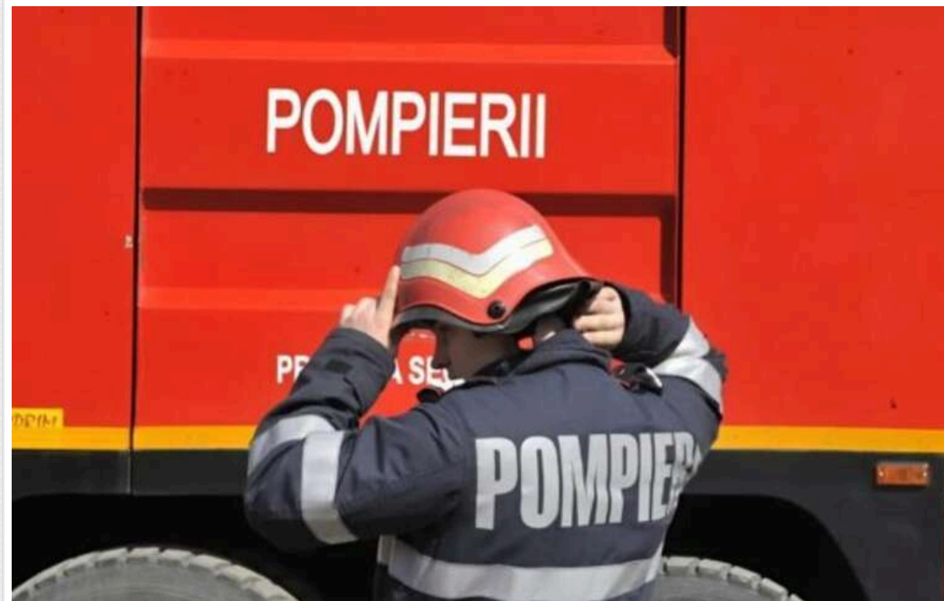
У Греції рятувальники організували страйк, вимагаючи стабільної роботи

У грецьких Афінах у п'ятницю десятки сезонних пожежників, які укладають контракти на роботу в сезон лісових пожеж у країні, протестували, вимагаючи постійного працевлаштування.