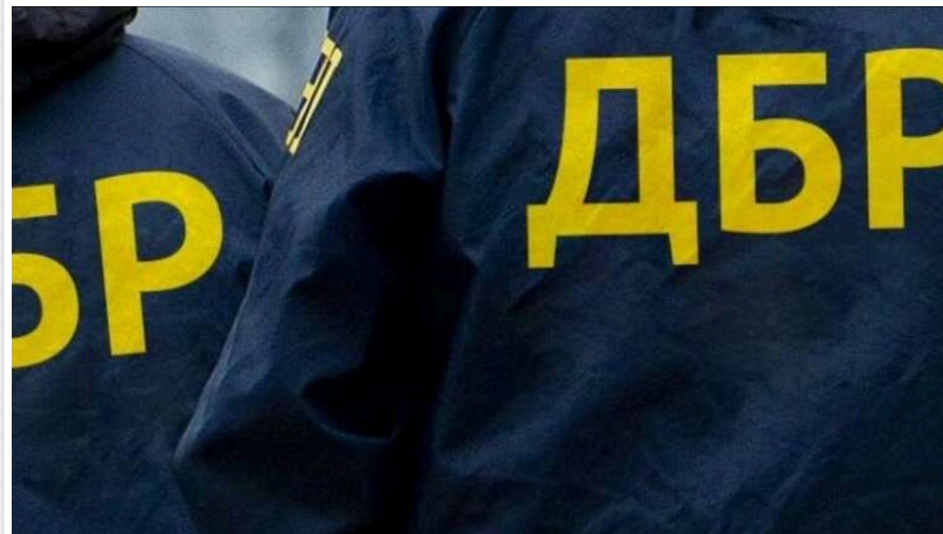
Викрили полковника медичної служби, який сприяв отриманню його дружиною майже 1 мільйон гривень «бойових»

Співробітники Державного бюро розслідувань оголосили підозру полковнику медичної служби, який допоміг своїй дружині отримати майже 1 мільйон гривень виплат за участь у бойових діях, хоча вона перебувала в тилу.