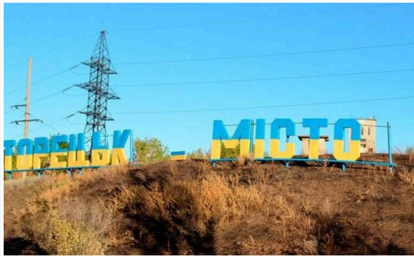
В ОТУ "Луганськ" спростували, що окупанти повністю захопили Торецьк і Часів Яр

У зоні відповідальності ОТУ «Луганськ» росіяни змінили тактику, намагаючись діяти малими диверсійними групами. Інформація, яку вони поширюють у соцмережах про те, що армія РФ повністю захопила Часів Яр і Торецьк, не відповідає дійсності.