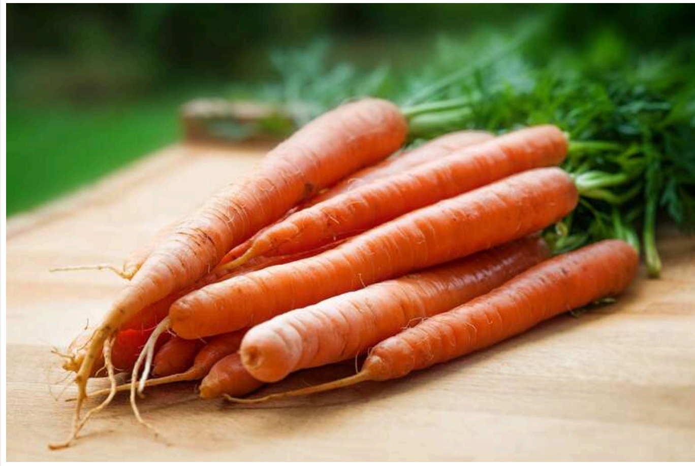
В Україні значно зросла ціна на популярний овоч

В Україні підвищуються ціни на моркву найвищої якості. Це викликано тим, що гуртові компанії активно закладають овоч для зберігання, а роздрібні покупці формують запаси на зиму.