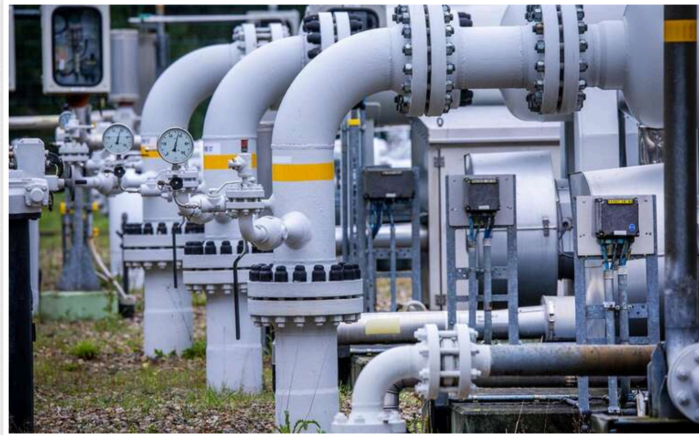
Європа близька до укладення угоди про транзит газу з Азербайджану через Україну

Угорщина та Словаччина наближаються до укладення угоди з Азербайджаном щодо постачання природного газу до Європи після закінчення транзитного договору між Росією та Україною.