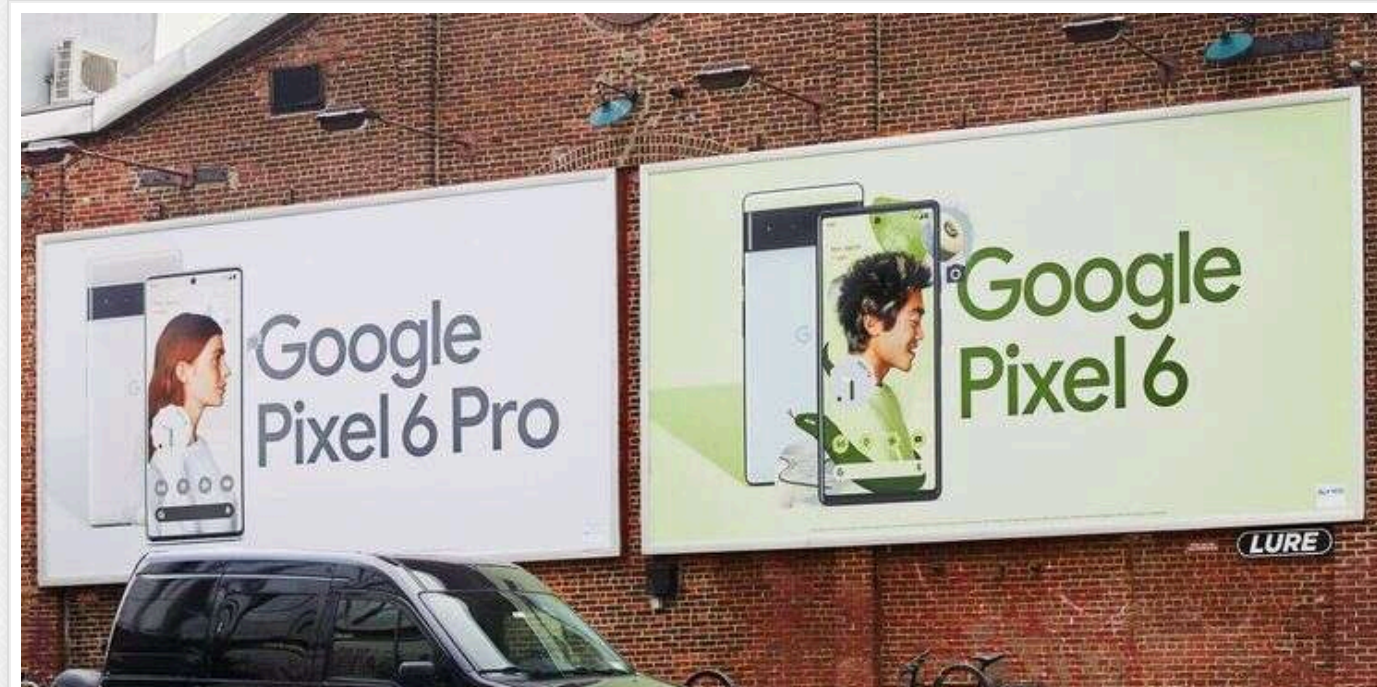
Індонезія заборонила продаж смартфонів Google Pixel

Індонезія заявила, що заборонила продаж смартфонів Google через правила, які вимагають використовувати компоненти місцевого виробництва, через кілька днів після того, як був заборонений продаж iPhone 16 з тієї ж причини.