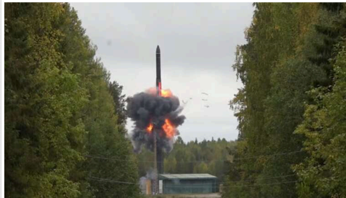
Defense Express: Північна Корея, ймовірно, могла скопіювати ракету Hwasong-19 з російського "яrsa"

Існує ймовірність, що КНДР скопіювала ракету Hwasong-19 з російського ракетного комплексу "Ярс". Не виключено, що Пхеньян лише трохи вдосконалив її.