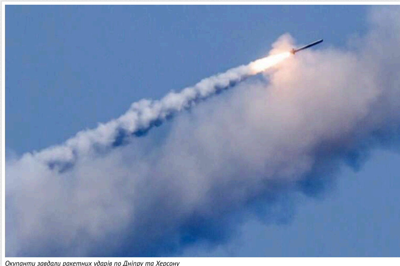
Окупанти завдали ракетних ударів по Дніпру та Херсону

Російські загарбники завдали ракетного удару по Херсону. Відомо про одного постраждалого, в якого вибухова травма та поранення.