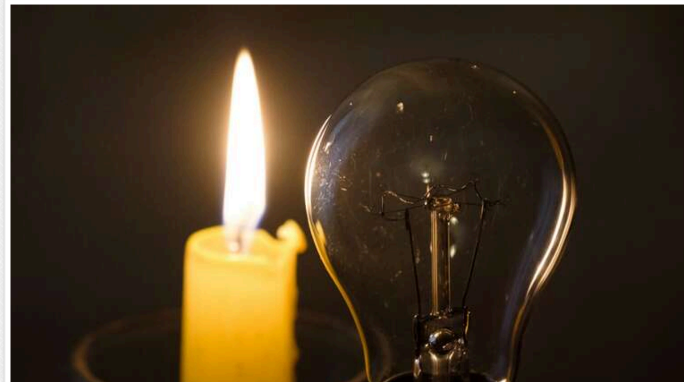
З наступного тижня можуть відновитися відключення світла - через похолодання, - Величко

На це вказує член наглядової ради "Центрэнерго" Володимир Величко.