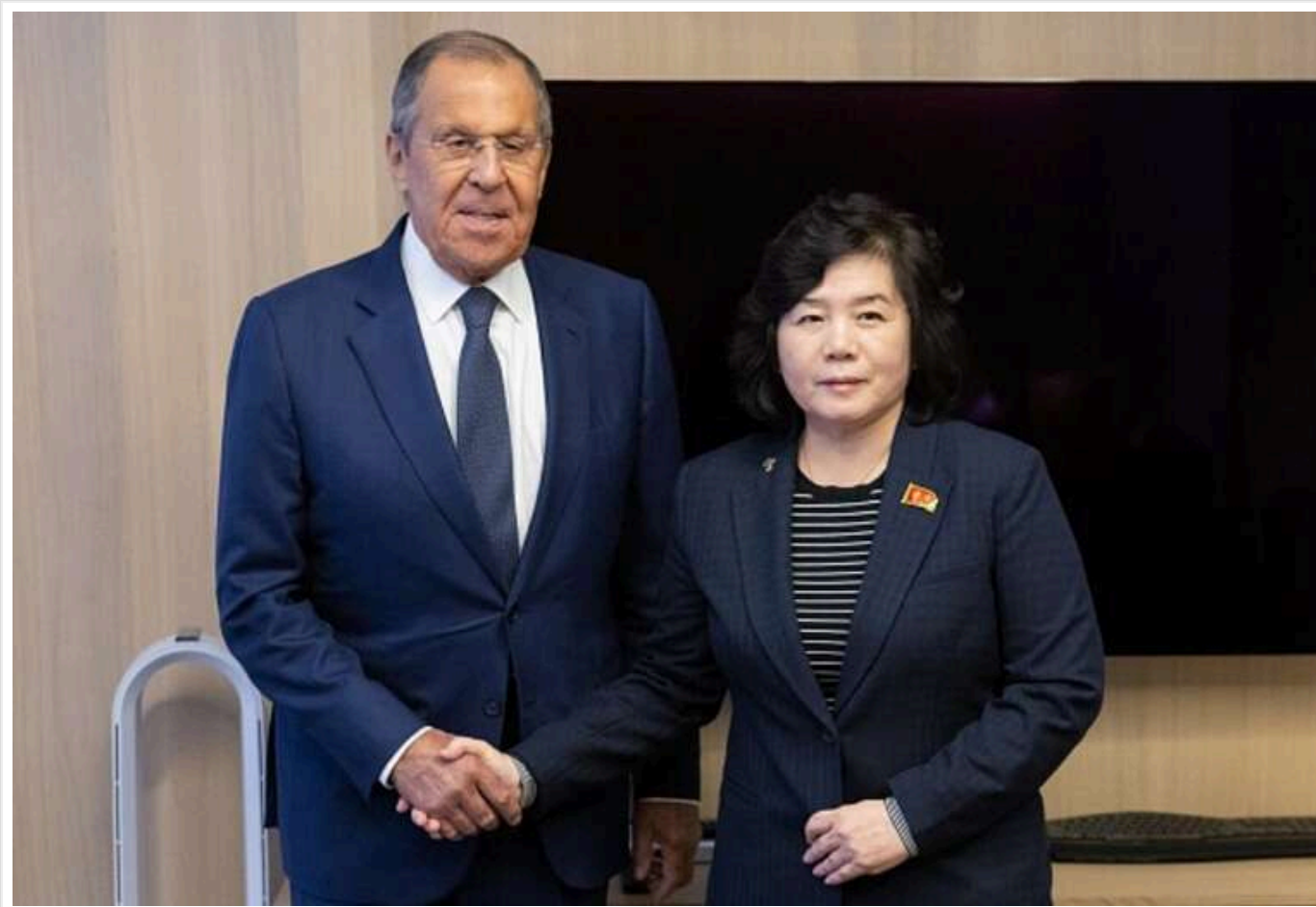
КНДР має намір "твердо підтримувати російських товаришів" і "абсолютно впевнена в тріумфі" ЗС РФ

Таку заяву озвучила міністерка закордонних справ Північної Кореї на зустрічі з Лавровим.