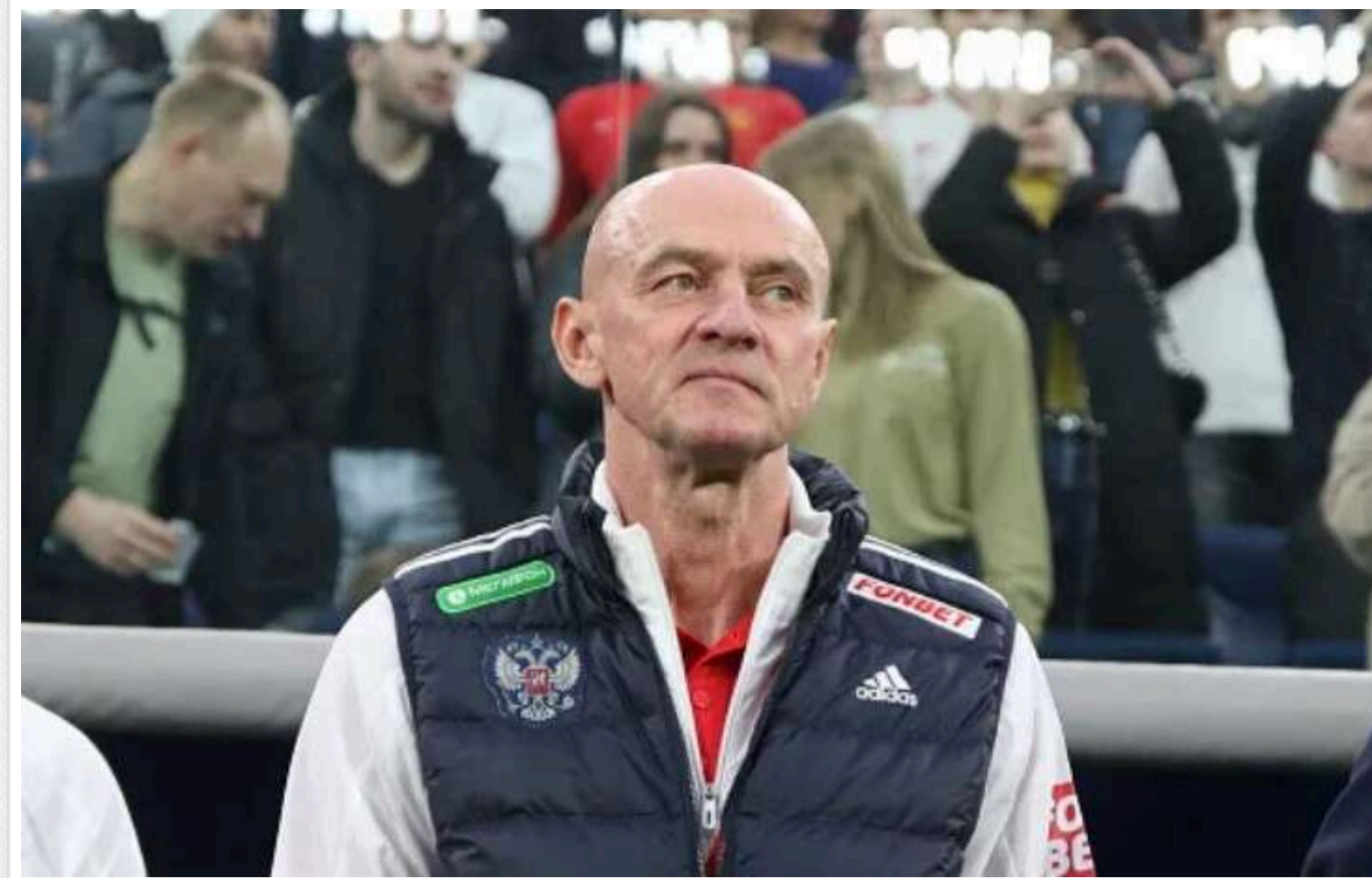
Футболіст із Луганська висловився про велич Росії і став об'єктом для насмішок

Легендарний російський футболіст Віктор Онопко відзначив ініціативи Росії щодо виховання молоді. На думку 55-річного уродженця Луганська, національна команда є прикладом для народу.