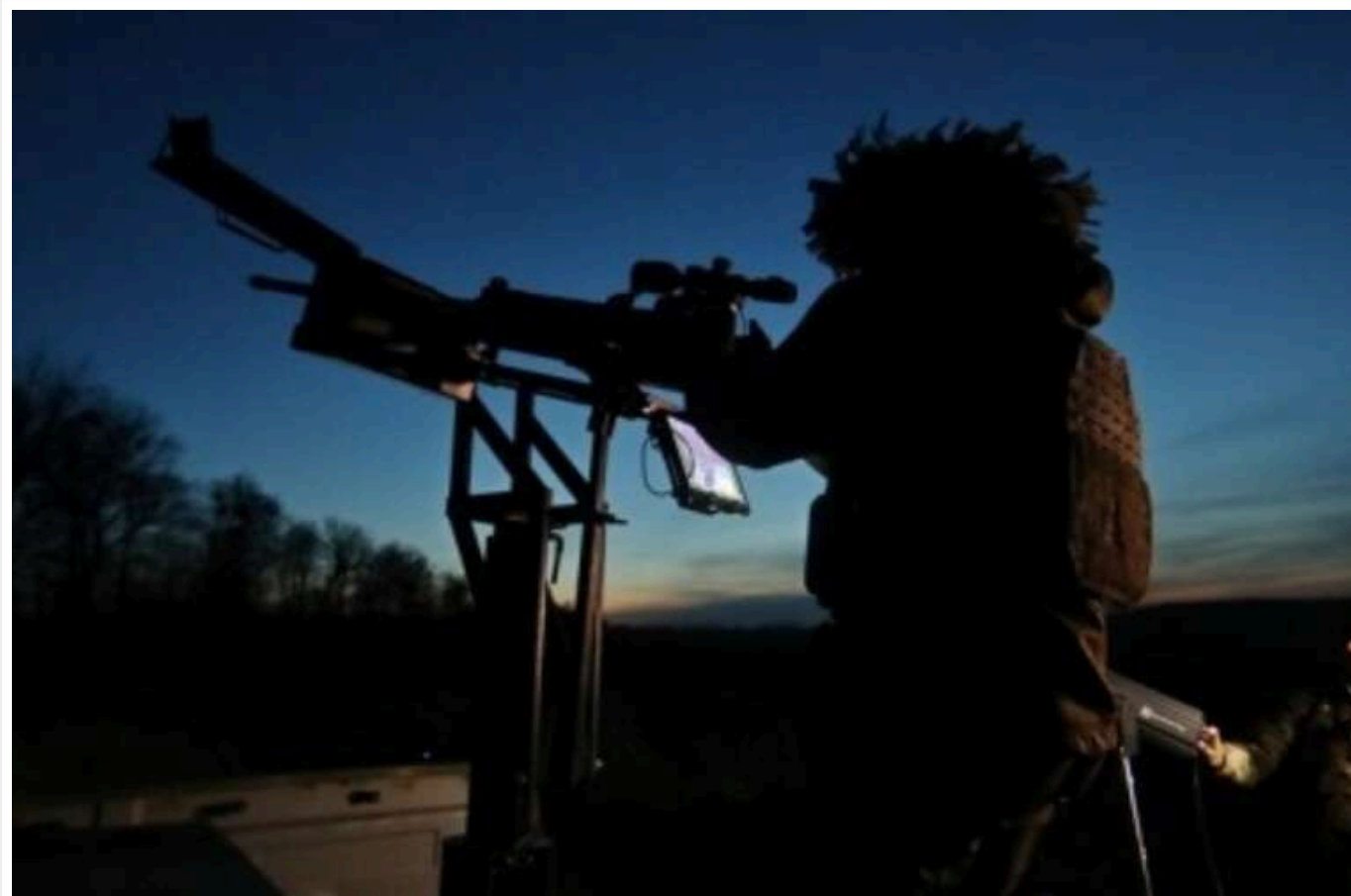
На Сумщині ППО вночі збила 7 дронів-камікадзе

У ніч на 1 листопада в небі над Сумською областю зенітники знищили сім російських дронів типу Shahed.