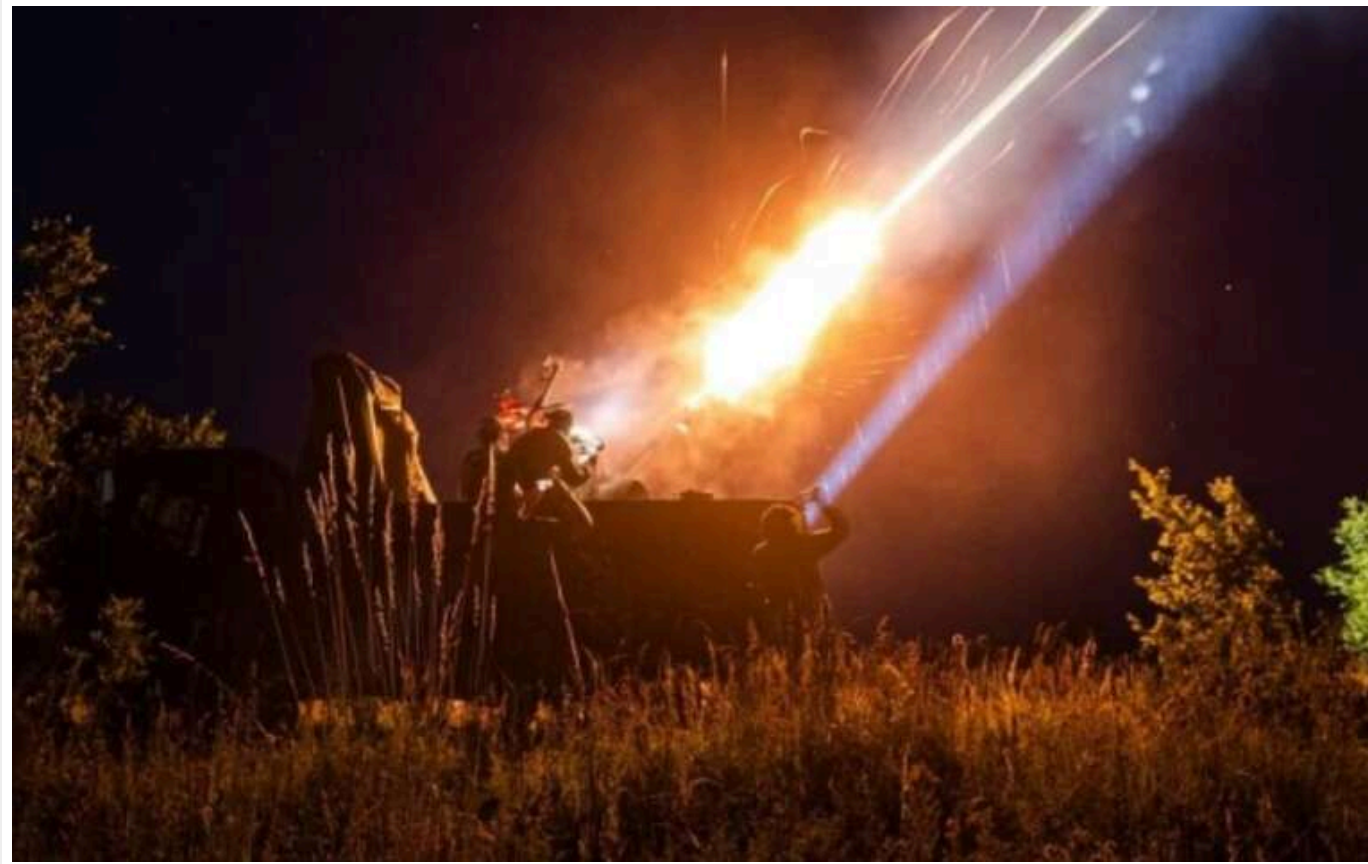
Сили ППО збили 31 російський БпЛА та одну ракету

Сили оборони збили 31 російський безпілотнок та одну керовану авіаційну ракету X-59/69, якими росіяни з вечора атакували Україну.