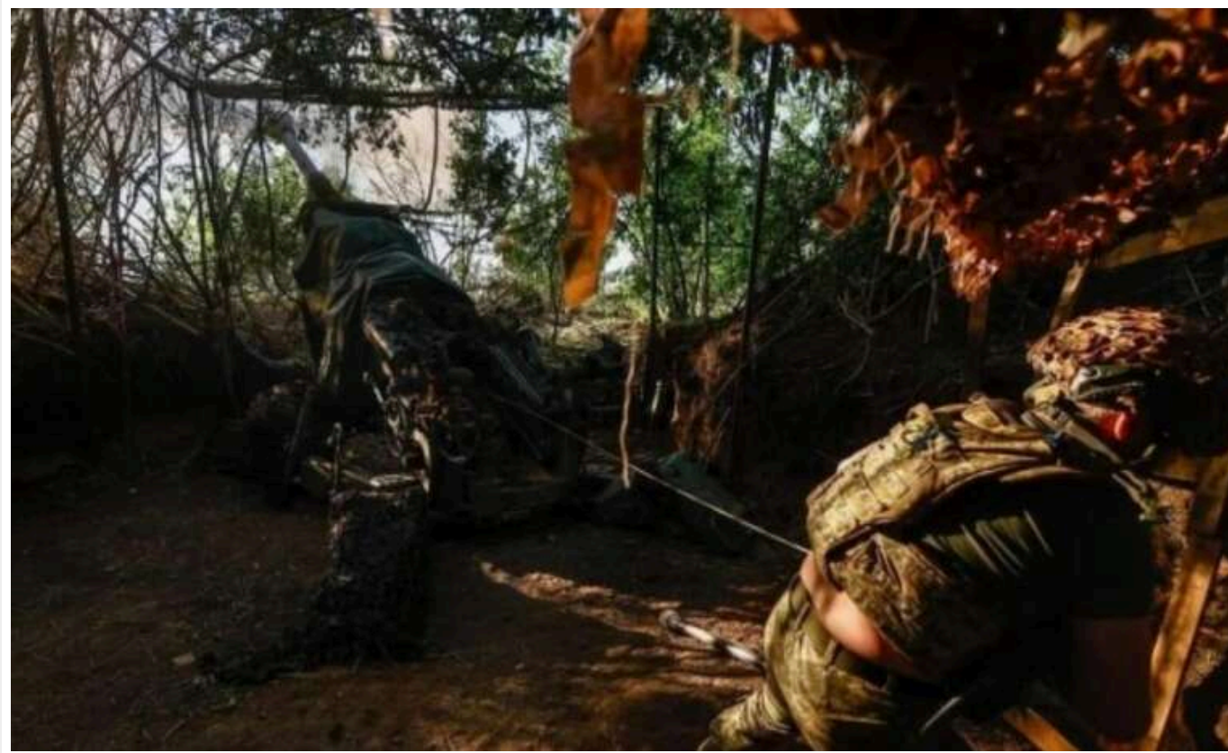
Ситуація на фронті: за минулу добу відбулося 170 бойових зіткнень

За останню добу на фронті сталося 170 бойових зіткнень. Сили оборони уразили 9 районів, де були зосереджені особовий склад та техніка російських загарбників.