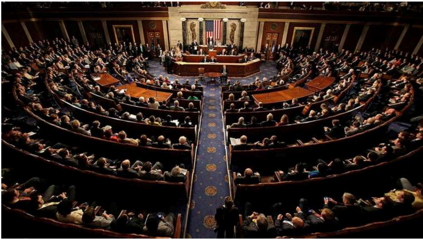
У Конгресі США пропонують розглянути разом із НАТО можливість завдання удару по військових силах КНДР в Україні

Голова комітету з розвідки Палати представників Майк Тернер вважає, що США та союзники по НАТО повинні розглянути можливість атаки "прямо на північнокорейські війська", якщо вони перебуватимуть на території України та братимуть участь у бойових діях на боці РФ.