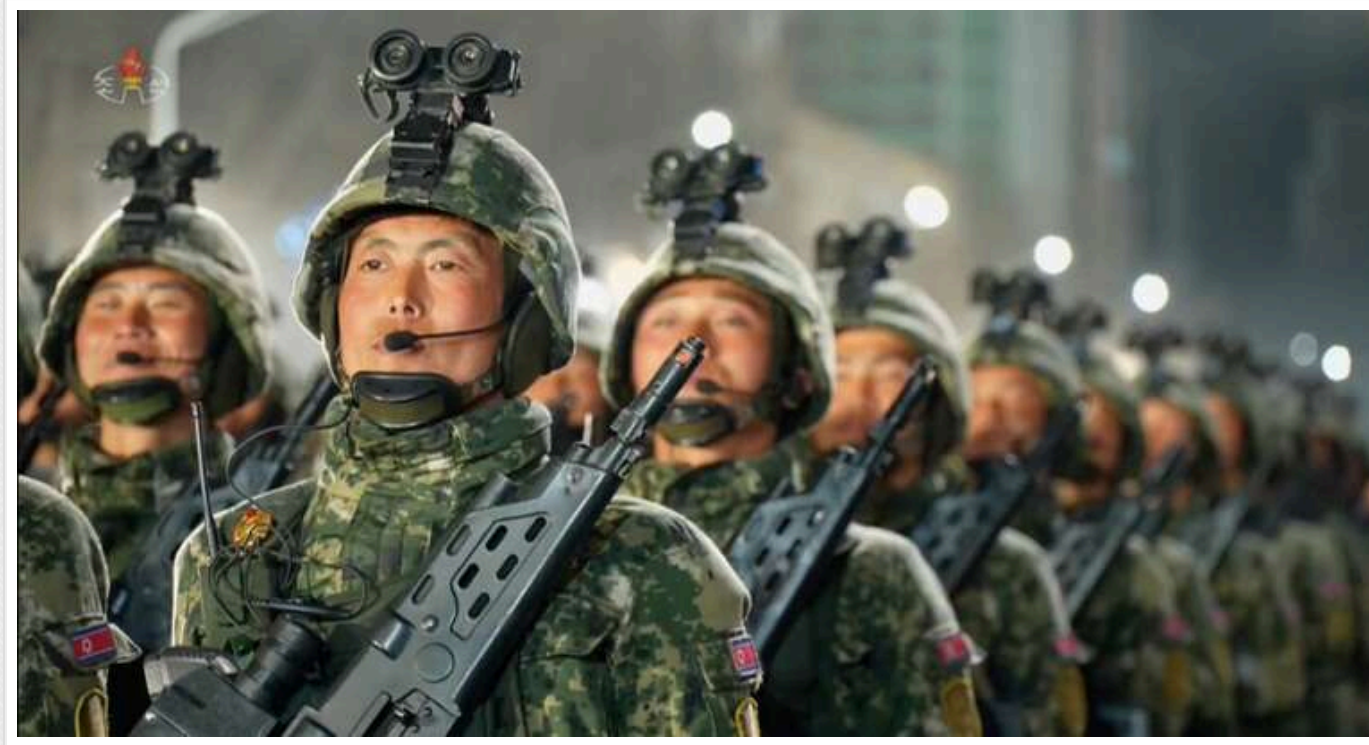
Військові з КНДР самі "прагнуть" поїхати в Україну

Для солдатів Північної Кореї поїздка до Росії та участь у російсько-українській війні може бути навіть приводом для гордості, а ще це розглядається як рідкісна можливість добре заробити та досягти привілейованого становища, пише Independent з посиланням на колишніх північнокорейських військовослужбовців.