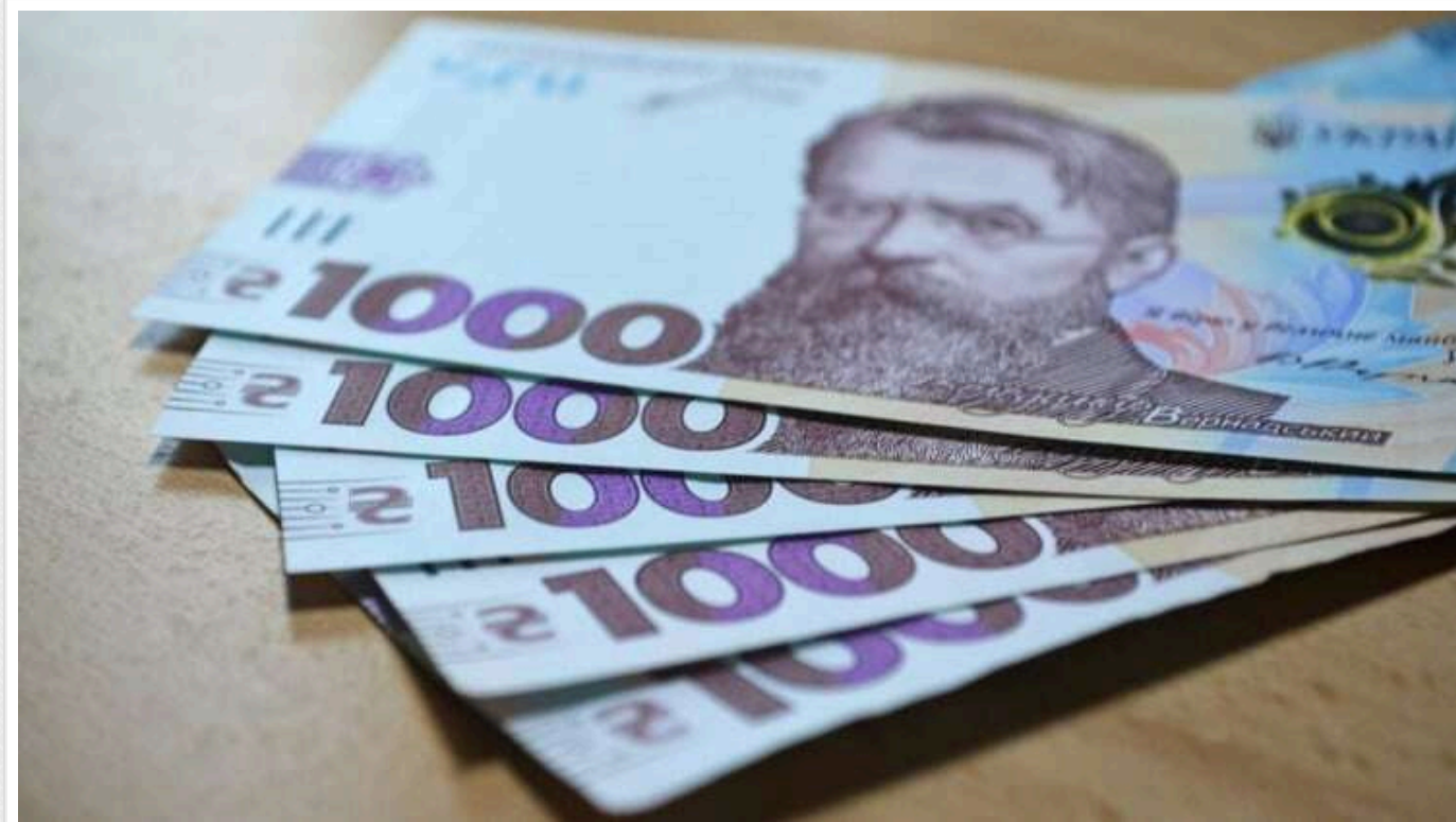
Аферисти вхопилися за "тисячу Зеленського"

Одразу після оголошення президента Володимира Зеленського про виплату тисячі гривень кожному громадянину України, шахраї стали більш активними. Вже почали з'являтися фейкові повідомлення, метою яких є отримання доступу до банківських карток довірливих українців.