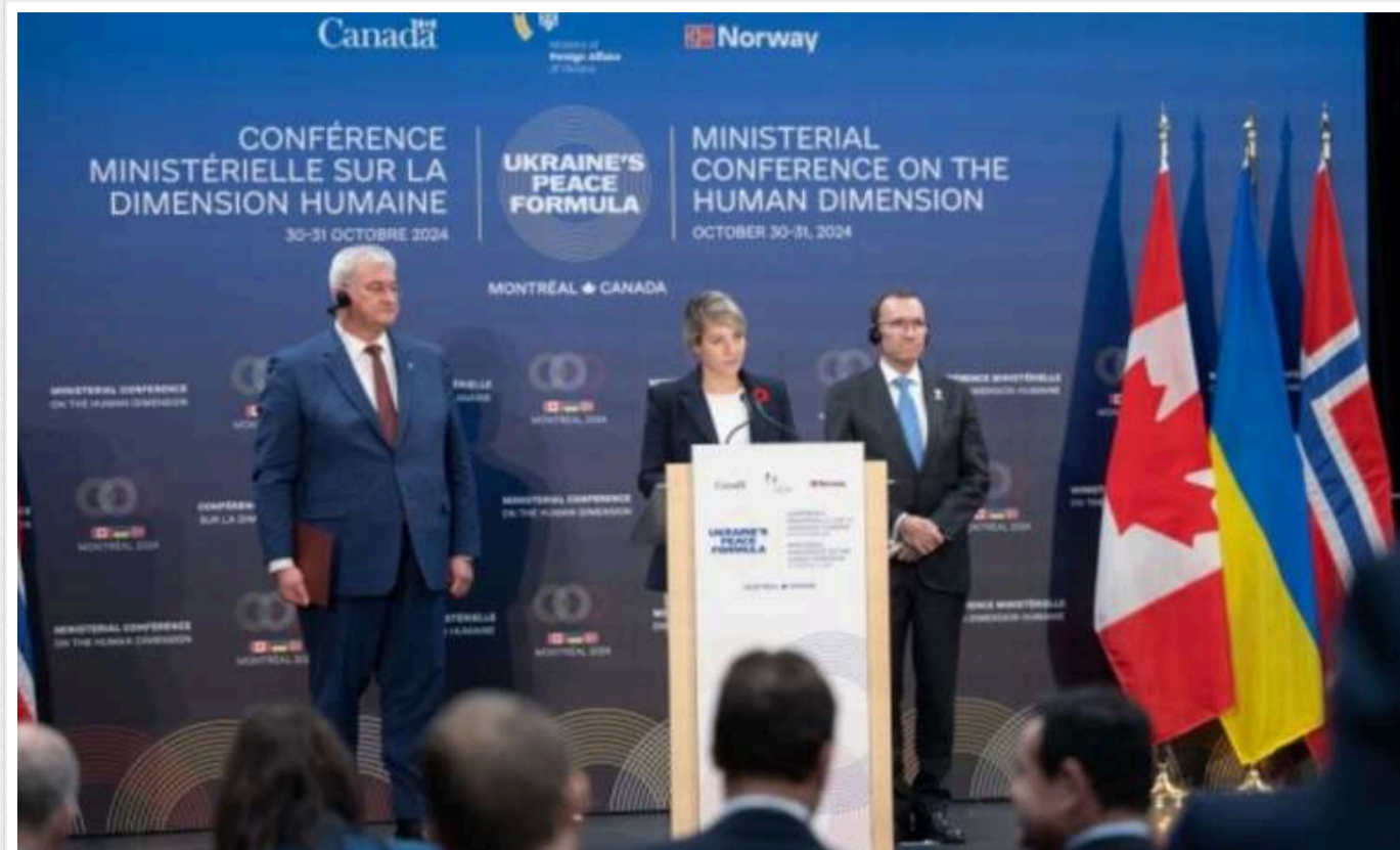
Кілька країн зобов'язалися повернути полонених і депортованих українців

У Монреалі (Канада) за підсумками конференції з питань людського виміру української Формули миру було ухвалено спільне комюніке. Країни-учасниці взяли на себе зобов'язання щодо повернення всіх полонених і депортованих громадян України, які були затримані російськими окупантами.