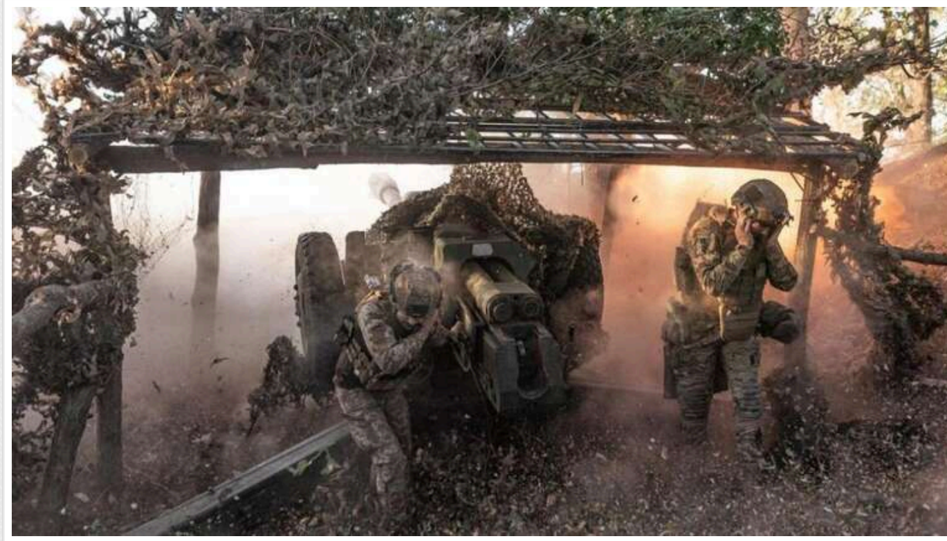
Війська РФ штурмують Трудове на Курахівському напрямку

Російські війська активно атакують Трудове в напрямку Курахового в Донецькій області.